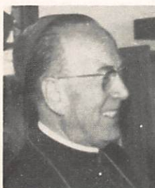
Franz Cardinal Koenig Presidente 1969-1978