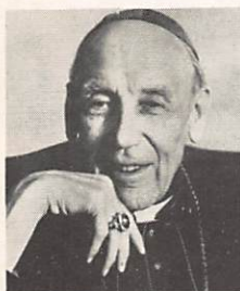
Augustine Cardinal Bea Fundador 1968