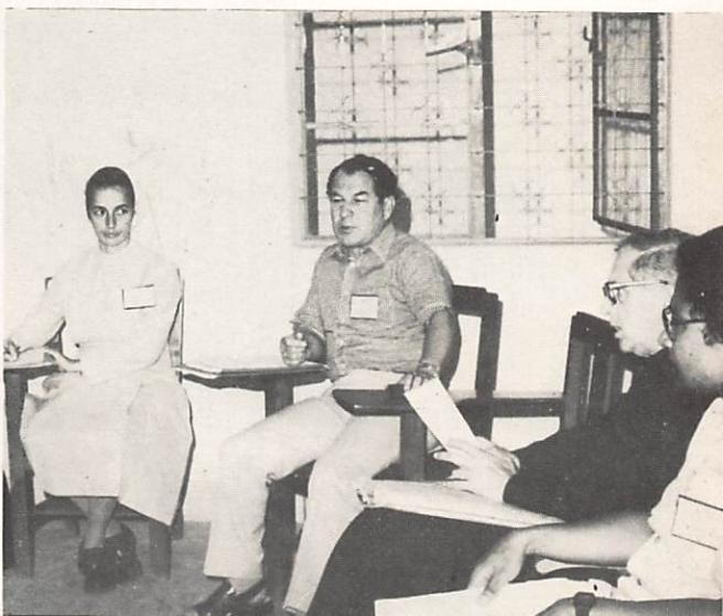
América Latina estuvo presente en Bangalore. En Bogotá quiere intensificar su propia creatividad al servicio de la Palabra de Dios.