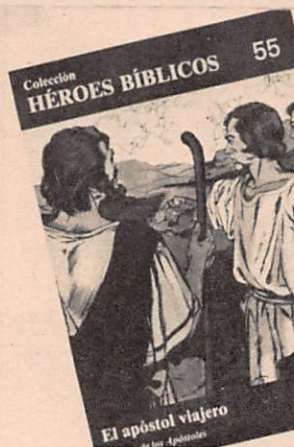
El apóstol viajero

El mundo de Jesús ya está lleno de gentes que creen en su vida y en su mensaje. Pero, ¿cómo se puede evangelizar a los que no creen? El apóstol viajero es un libro que responde a esta pregunta. En este libro se narra la vida de un apóstol que viaja por el mundo para anunciar el Evangelio. El libro está dividido en capítulos que narran las aventuras del apóstol en diferentes lugares. El libro es un buen material para enseñar a los niños sobre la vida de los apóstoles y sobre el mensaje del Evangelio.