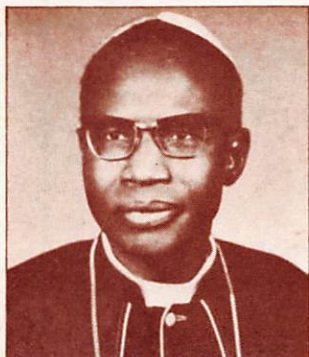
Pablo Cardinal Zoungrana Ougadougou, Alto Volta